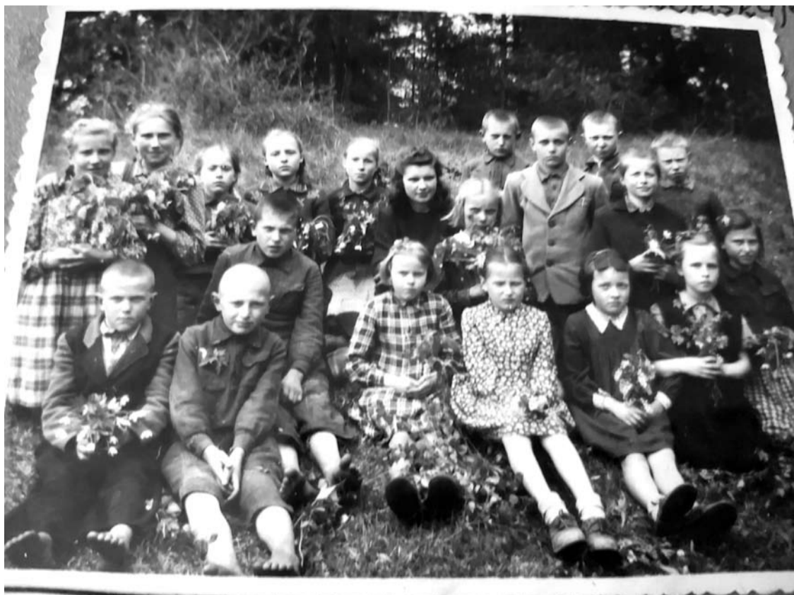
Pirmieji auklėtiniai Daliėčių mokykloje.