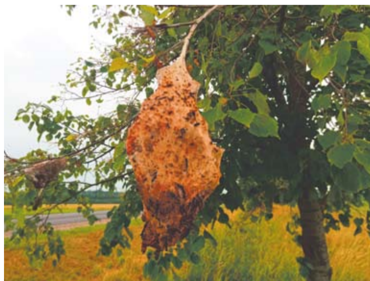
Budrių kaime šiemet fotografuotas pūkapilvio verpiko vikšrų lizdas.

graužė seną liepą ir iki dabar dar kabo vienas šilkinis lizdas, tiesa, pačių vikšrų jau nematyti – likusios tik jų išnaros. Šiuo metu vikšrai jau virtę lėliukėmis ir žiemos iki balandžio mėnesio ar net dar ilgiau. Kol lieka keletas neapgraužtų didelių medžių – liepų, nuo kurių čia gyvenantiems reikalingi liepžiedžiai, lai gyvena šie drugiai, tegul sau skraido. Kad tik neaptų per daug dažna ši rūšis, o kol kas visiems vietos gamtoje tikrai pakaks.