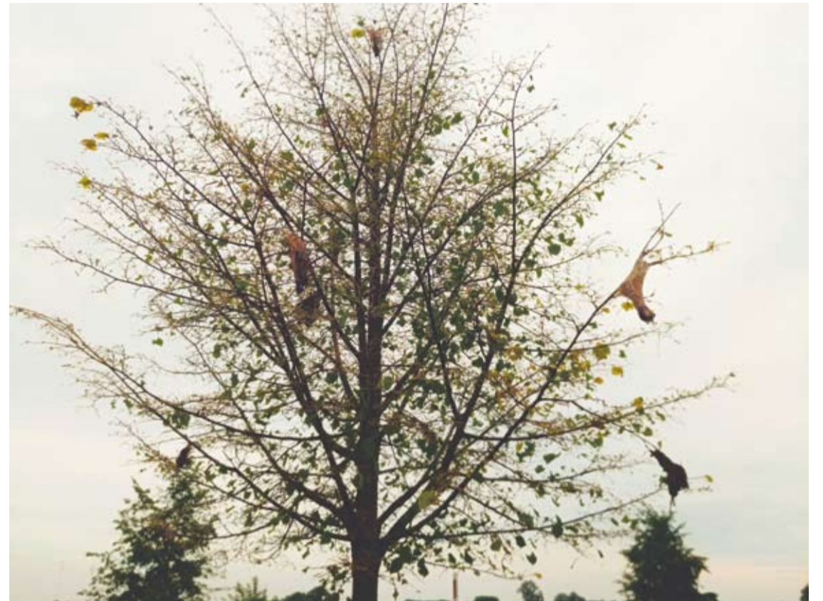
Verpikų vikšrų suformuoti lizdai dar kabo šalikelėje prie Kavarsko.

Literatūros duomenimis, drugiai pradeda skraidyti balandžio