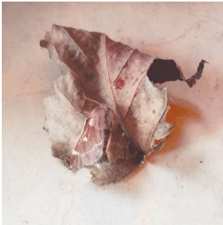
Pūkapilvis verpikas, arba kitaip – pūkinis verpikas.

Kam tenka važiuoti keliu Kavarskas-Svirnai, jau ne pirmus metus abipus kelio mato daug pažeistų, apgraužtų lapais liepų ir keistus, kabančius maišelius medžių šakų gale. Tai pūkapilvio verpiko – verpikų šeimos drugio – tankūs, įvairių netaisyklingų formų, ištišę šilkiniai siūlų lizdai. Juose kurį laiką gyvena drugio vikšrai.