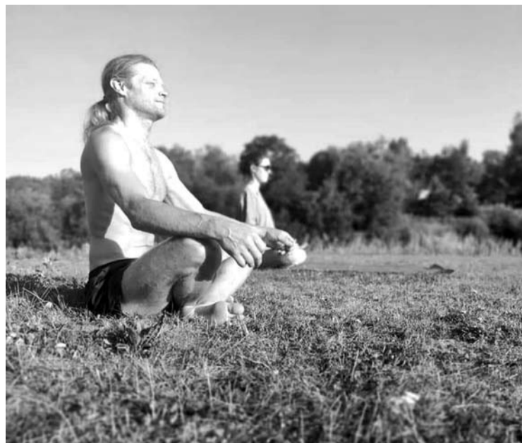
Sveikos gyvensenos mylėtojams rytiniai ritualai įkrauna energijos ir pozityvo dienai.