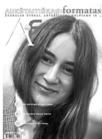
Antrasis žurnalo „Aukštaitiškas formatas“ numeris prekyboje nuo birželio mėnesio.